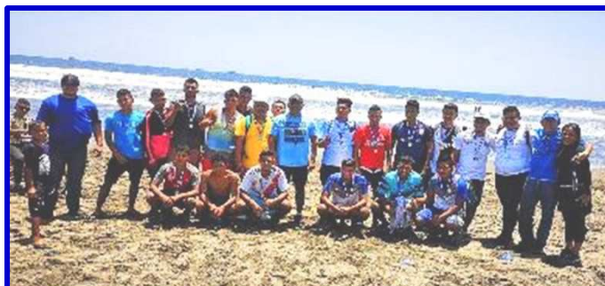
Las playas de "Paso Caballo" fue uno de los escenarios donde fue muy acogido el deporte de Fútbol Playa.

Cada evento contó con la coordinación de los miembros de los Comité de Liderazgo Sandinistas de las zonas, Alcaldías Municipales de cada localidad, Movimiento Deportivo "Alexis Argüello", Juventud Sandinista 19 de Julio, Instituto de Turismo, Bomberos y Policía Nacional,