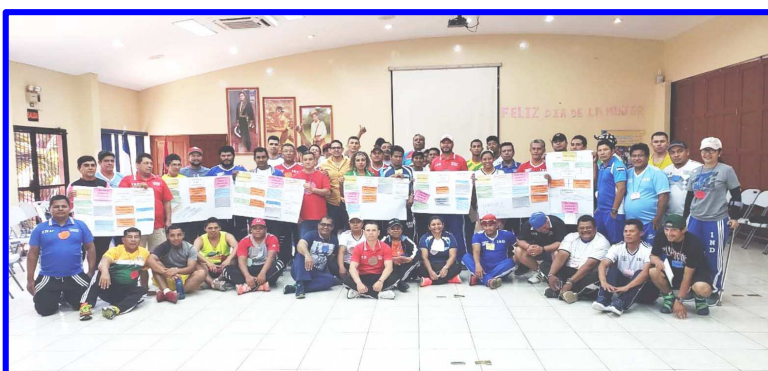
Profesores de las Academias de Enseñanza Deportiva del IND, recibieron importante Programa de Capacitación.