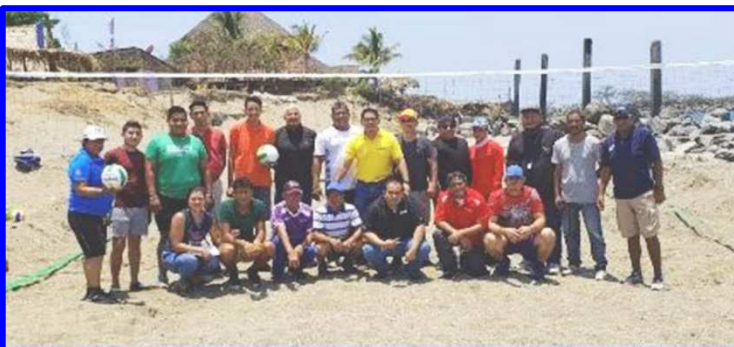
Entrenadores, profesores de Educación Física y activistas de deporte de municipio de Corinto recibieron importante capacitación deportiva.

Dicho curso fue impartido por los prestigiosos especialistas de dicho deporte, Lic.