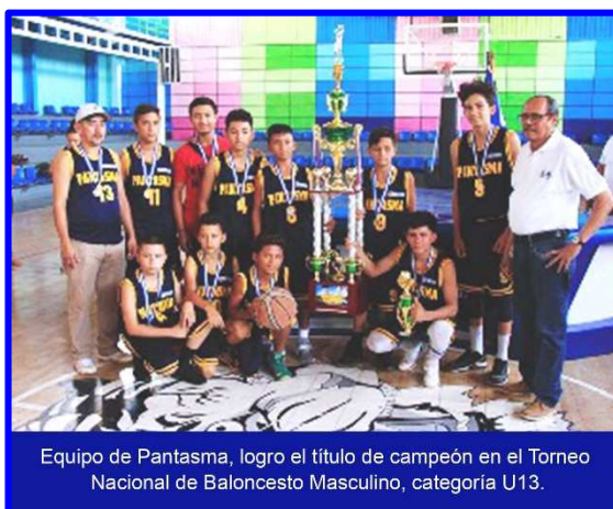
Equipo de Pantasma, logro el título de campeón en el Torneo Nacional de Baloncesto Masculino, categoría U13.