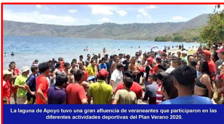
La laguna de Apoyo tuvo una gran afluencia de veraneantes que participaron en las diferentes actividades deportivas del Plan Verano 2020.

El Instituto Nicaragüense de Deportes (IND), a través de sus Delegados Departamentales y la Dirección de Recreación Física respaldó a nivel nacional en un cien por ciento todas las actividades deportivas que fueron programadas para la realización del Plan de Verano