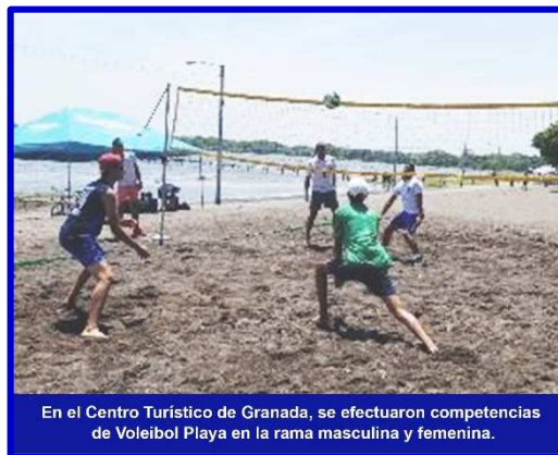
En el Centro Turístico de Granada, se efectuaron competencias de Voleibol Playa en la rama masculina y femenina.