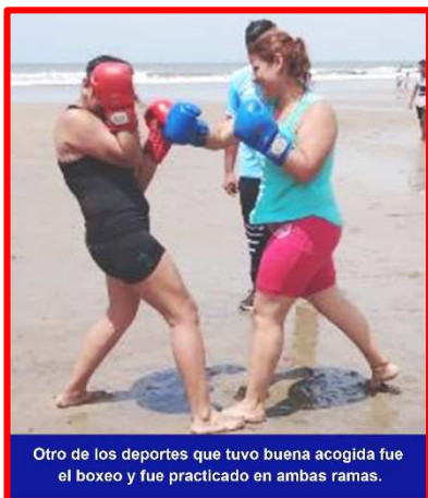
Otro de los deportes que tuvo buena acogida fue el boxeo y fue practicado en ambas ramas.

todos ellos en coordinación también con la Dirección de Deportes y el Instituto Nicaragüense de Deportes (IND).