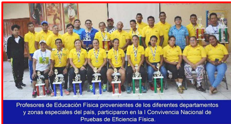
Profesores de Educación Física provenientes de los diferentes departamentos y zonas especiales del país, participaron en la I Convivencia Nacional de Pruebas de Eficiencia Física.

La Dirección de Educación Física del Instituto Nicaragüense de Deportes (IND), llevó a cabo el jueves 2 de Abril desde la Pista de Atletismo del Estadio Olímpico del IND, la I Convivencia Nacional de las Pruebas de Eficiencia Física Magisteriales en donde se logró reunir a