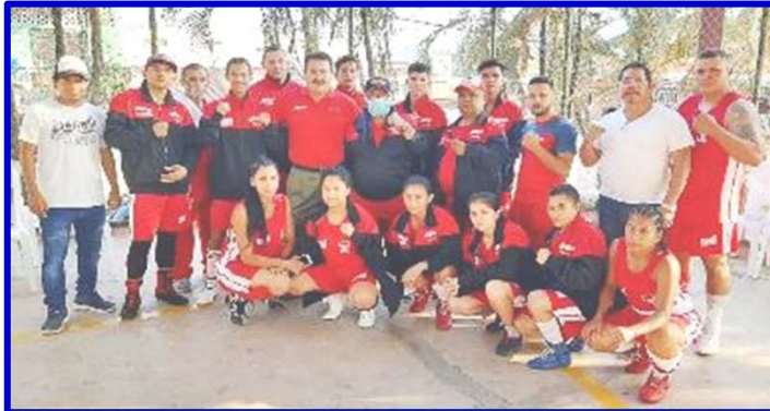
Equipo "Indígenas de Matagalpa", siempre de la batalla en cada una de las carteleras programadas de la VII Copa de Boxeo "Alexis Argüello".