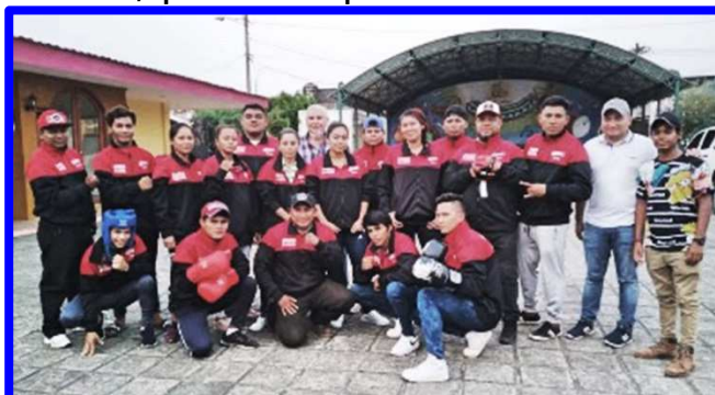
Equipo "Gladiadores de Masaya", empieza a tomar ventaja en las competencias del grupo A.

Y con otra sólida presentación, "Gladiadores" de Masaya empieza a tomar ventaja en la tabla de posiciones del Grupo "A". "Gladiadores" viajó hasta San Juan del Río Coco, Madriz, donde la plaza del Mercado Municipal, tuvo una excelente asistencia de aficionados, que con sus aplausos reconocieron el trabajo desempeñado por los pugilistas