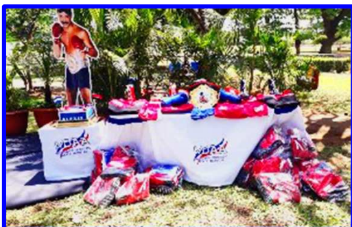
Parte del material deportivo que se entrega a cada una de las escuelas de boxeo que participan en la VII edición de la Copa de Boxeo "Alexis Argüello".

En Jinotega el equipo "Guerreros de las Brumas", empató con "Huracanes del Caribe" (Costa Caribe Norte), tanto en masculino como femenino. Jinotega tuvo un notable ascenso posicional en la pasada Copa, como noveno en la tabla de posiciones y Caribe Norte quedó detrás (10º), y obviamente, en el ring se mostraron nivelados. Cada equipo ganó cinco combates, todos por decisión. Similar fue la acción en femenino, donde desafortunadamente cuatro boxeadoras no subieron al ring. Las ganadoras fueron Sara