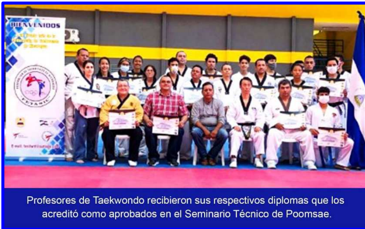
Profesores de Taekwondo recibieron sus respectivos diplomas que los acreditó como aprobados en el Seminario Técnico de Poomsae.