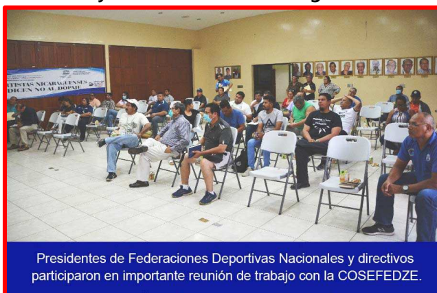
Presidentes de Federaciones Deportivas Nacionales y directivos participaron en importante reunión de trabajo con la COSEFEDZE.

Cabe mencionar que la COSEFEDZE, la integra una comisión integrada por Directores de algunas Áreas Sustantivas del Instituto Nicaragüense de Deportes (IND), encabezada por la Dirección Ejecutiva, la Dirección Administrativa Financiera, la Dirección de Instalaciones Deportivas,