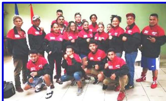
Equipo "Bravos de Chinandega", siempre se destaca en cada una de las ediciones de la Copa de Boxeo "Alexis Argüello".

Los capitalinos no tuvieron problema para vencer 19-12 a los "Canaleros" de Zelaya Central, aunque todas sus victorias fueron por decisión, dos de ellas porque los púgiles fallaron en báscula. Por los tetra-campeones Bryan Largaespada, que ascendió a los 56