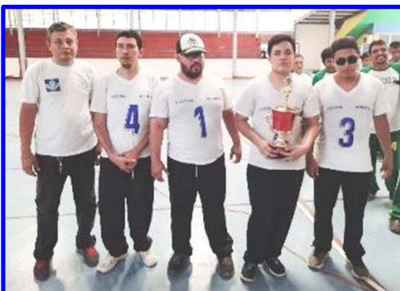
Jugadores del equipo de la Asociación Nicaragüense de Deporte para Ciegos fueron los campeones del Campeonato Nacional de Goalball.