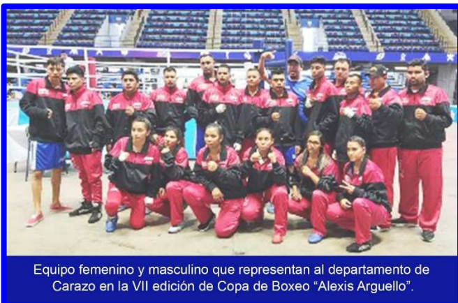
Equipo femenino y masculino que representan al departamento de Carazo en la VII edición de Copa de Boxeo "Alexis Argüello".

Las acciones de la VII Copa de Boxeo "Alexis Argüello", continuaron en el mes de Abril con la realización de interesantes carteleras boxísticas en los diferentes escenarios del país. Para el 4 de abril, "Flacos Explosivos" del grupo B (Managua 3) e "Indígenas" (Managua 2), fueron los principales ganadores se impusieron ampliamente 20-13 a "Caciques" de Carazo, que sólo ganaron dos combates masculinos. Sin embargo,